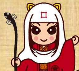
出世法師 直虎ちゃん