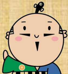
出世大名 家康くん